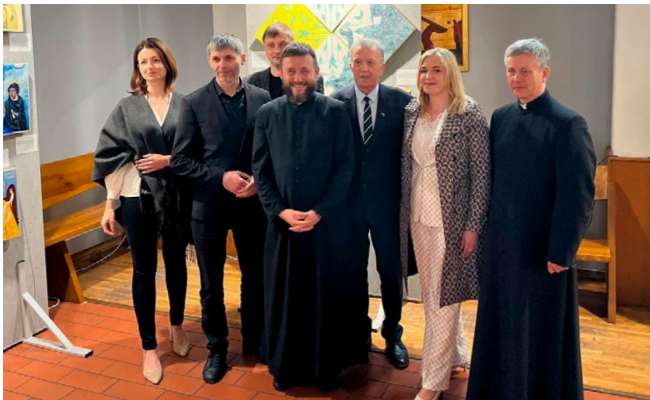
Виставка «Знак надії» в місті Щецин, Польща