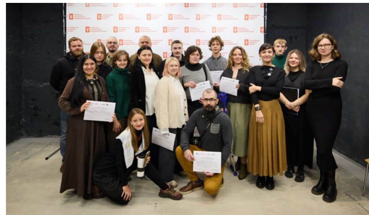
Офіційне відкриття Школи реставрації

Програма спрямована на соціальну фінансову підтримку студентів Львівської національної академії мистецтв — зокрема, фінансову допомогу студентам, які опинились у скрутному становищі внаслідок російсько-української війни або інших обставин — внутрішньо-переміщеним особам, дітям учасників бойових дій, дітям зниклих безвісти та загиблих захисників.