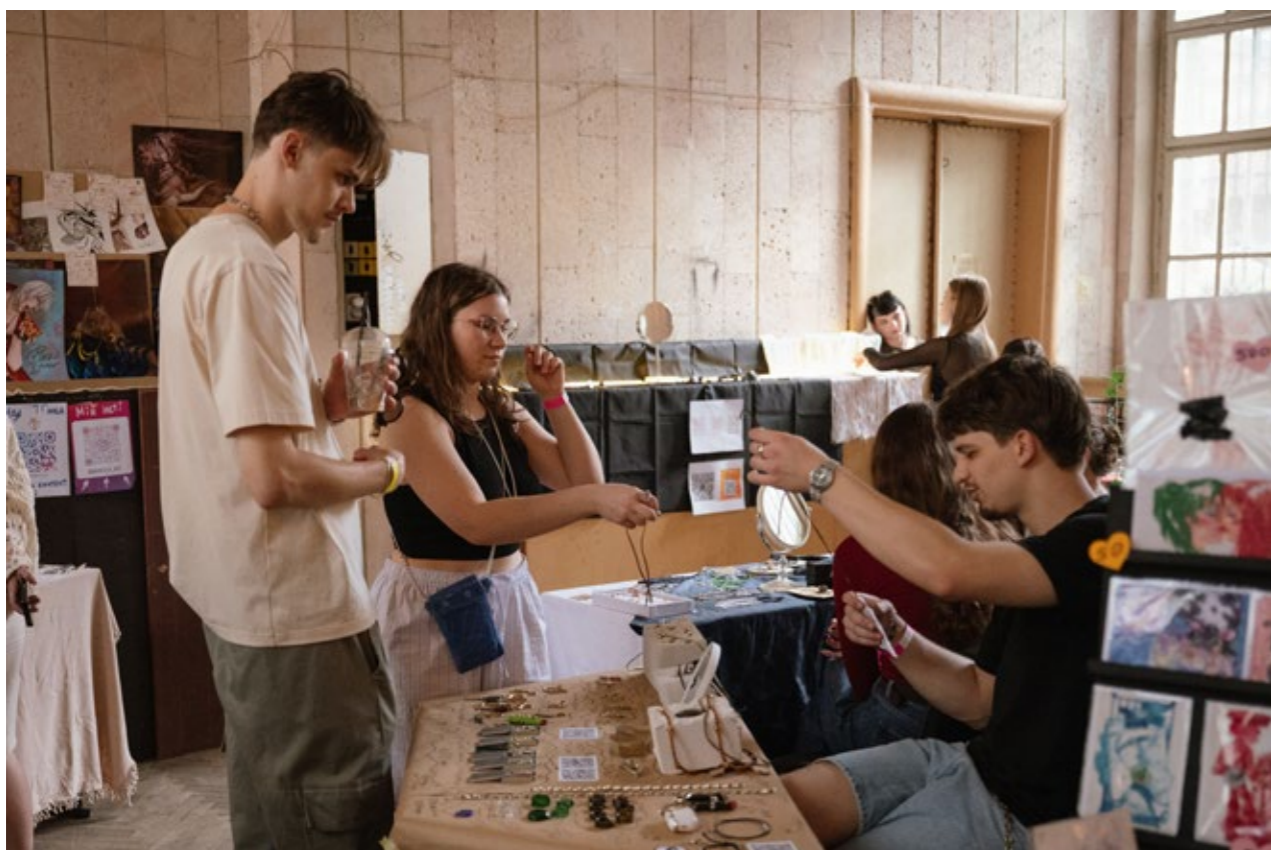
Благодійна виставка-ярмарок Крам в ЛНАМ.