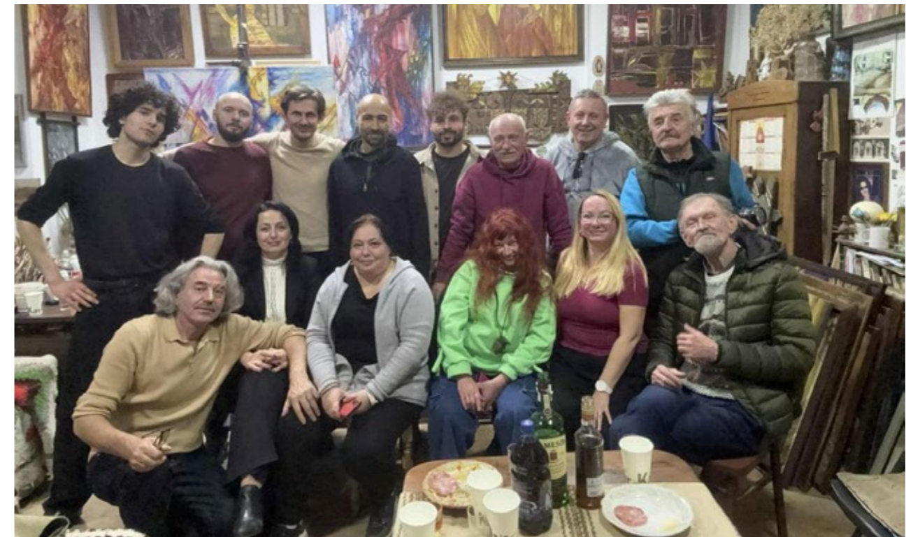
Живописний пленер «Косівський Гук».