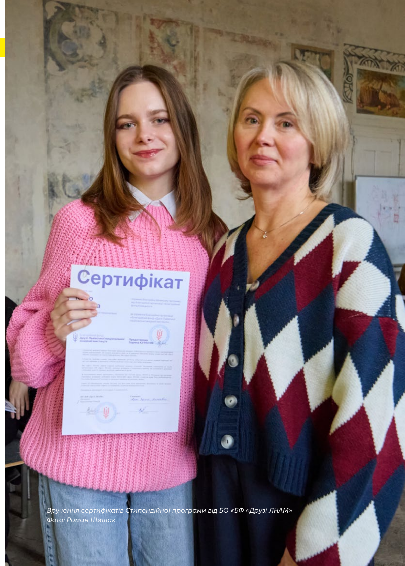
Вручення сертифікатів Стипендійної програми від БО «БФ «Друзі ЛНАМ»