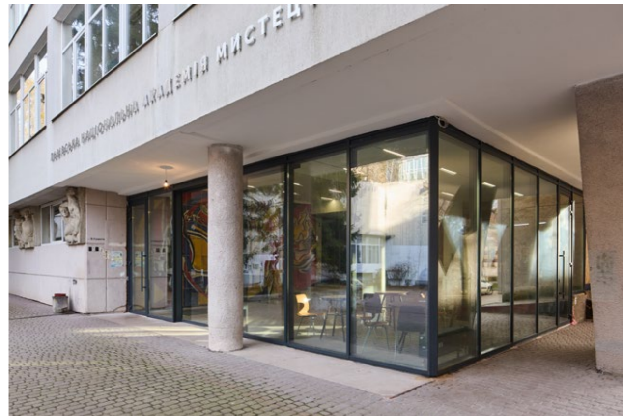
Ремонт та облаштування нового вхідного простору, скляна вітрина з розсувними дверима, новий санітарний блок із роздягальнями та душовими.