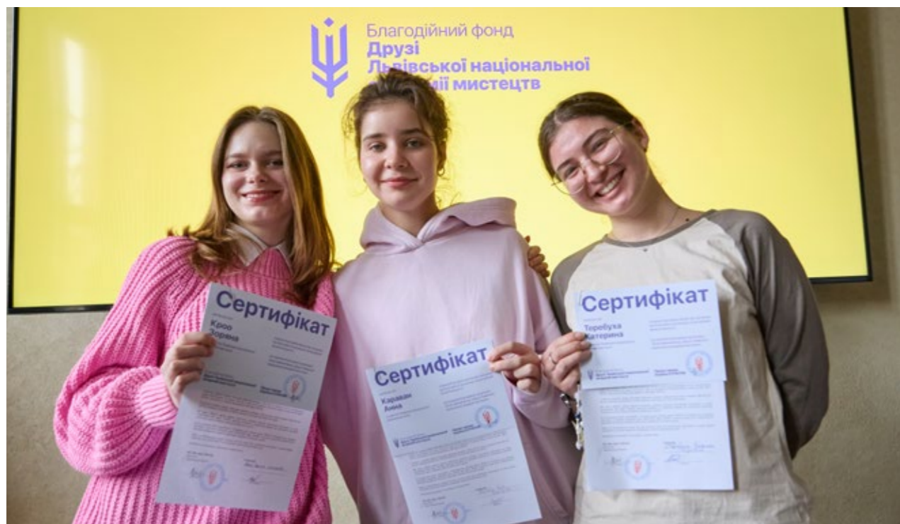
Вручення сертифікатів Стипендійної програми від БФ «Друзі ЛНАМ»