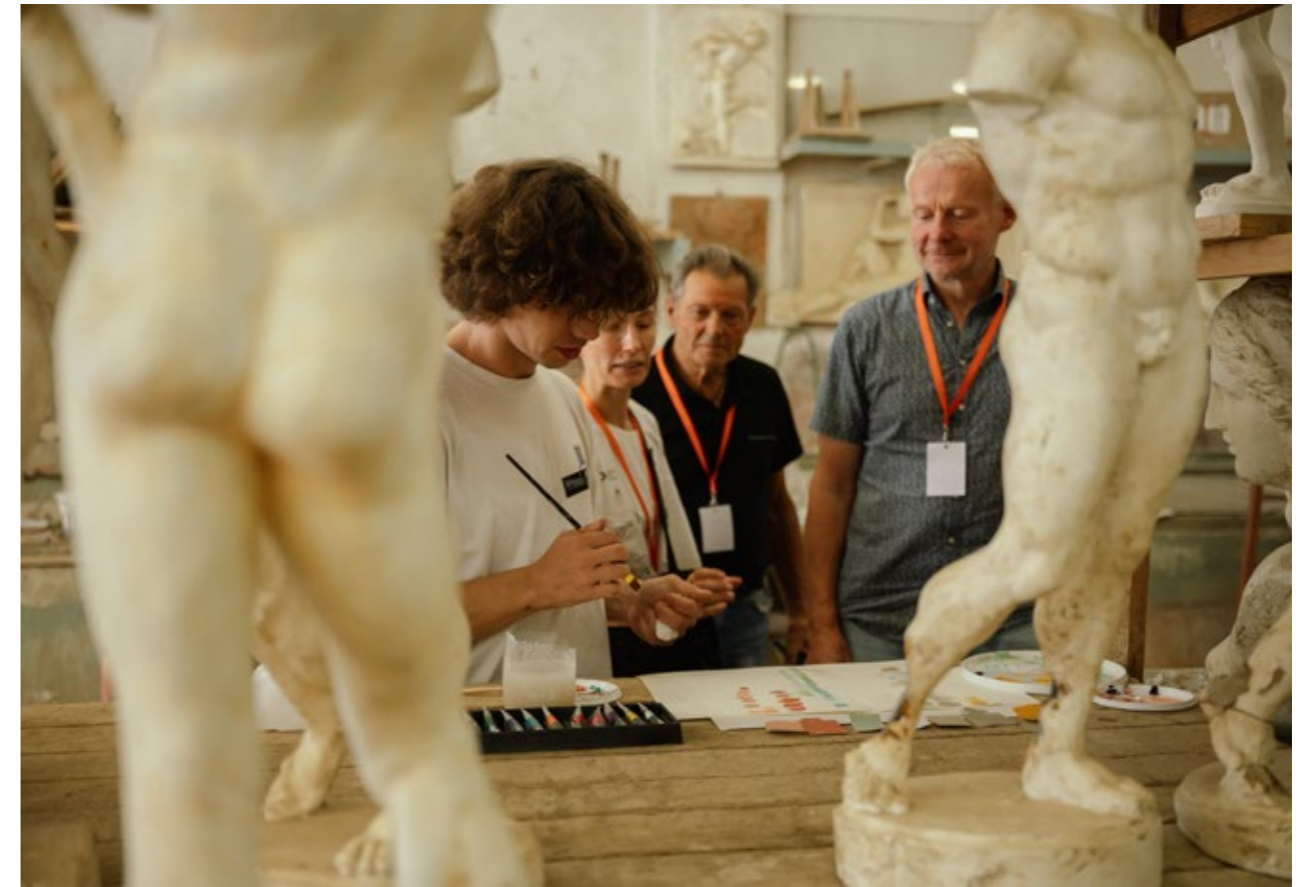
Практичний вступний іспит у Школу реставрації.