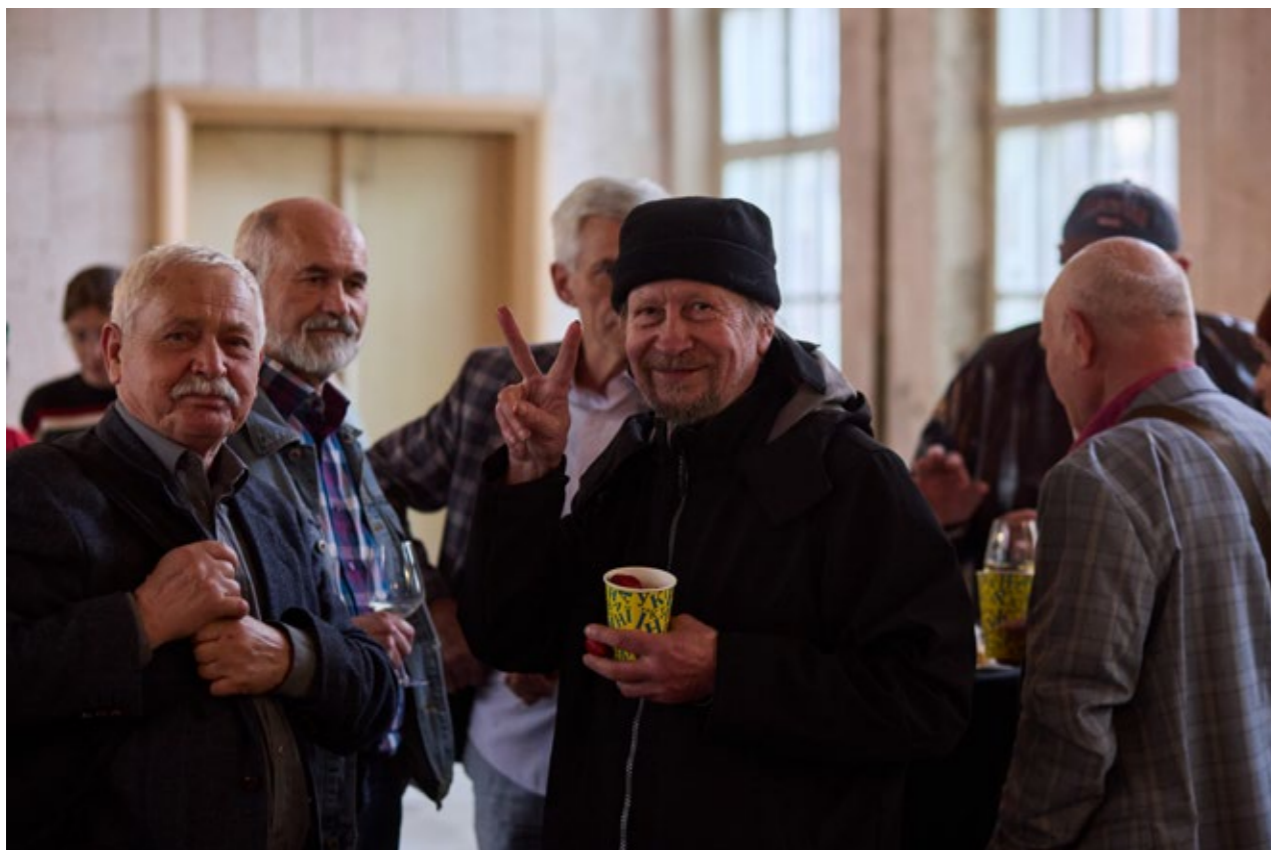
Зустріч випускників ЛНАМ у 2025 році.