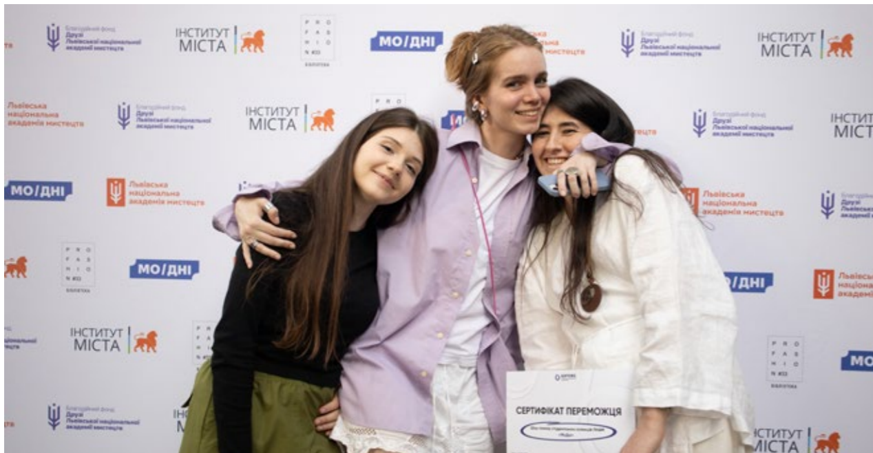
Перший шоу-показ студентських колекцій кафедри дизайну костюму «МоДні»